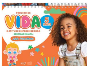
Livro OPEE: FRAIMAN, Leo. Projeto de vida e atitude empreendedora: educação infantil: 5 anos. São Paulo: FTD. EDIÇÃO RENOVADA 2026